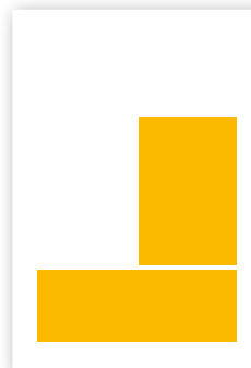
KVARTSIDA LIGGANDE 204 x 64 mm